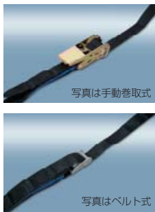
写真は手動巻取式