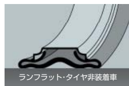
ランフラット・タイヤ非装着車