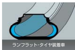
ランフラット・タイヤ装着車