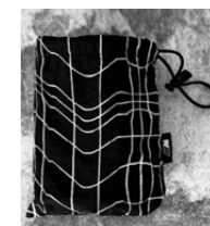
BMW カモフラージュ柄、M ロゴ・タグ付きの収納袋付き

※コーデュラ・ナイロン：「コーデュラ」は、ナイロンの特徴である軽さも保持しながら、強度のある糸を使って作られているため、摩擦、引き裂き、擦り切れにとても強く、耐久性に優れた素材です。 また裏面にはPU (ポリウレタン) 加工が施されており、撥水性もあります (完全防水ではありません)。