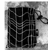
BMWカムフラージュ柄、 Mロゴ・タグ付きの収納袋付き

XS 8014 5B4C 818 S 8014 5B4C 819 M 8014 5B4C 820 L 8014 5B4C 821 XL 8014 5B4C 822 XXL 8014 5B4C 823