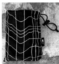
BMW カモフラージュ柄、M ロゴ・タグ付きの収納袋付き