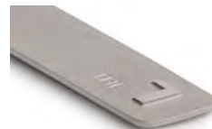
THE 1 8027 5A87 978