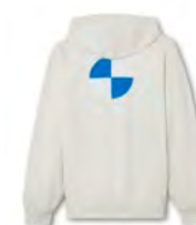
バッグ・スタイル