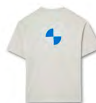
バッグ・スタイル