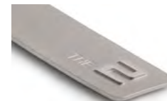
THE 2 8027 5A7E 4C0