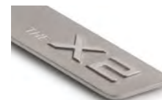
THE X2 8027 5A87 986