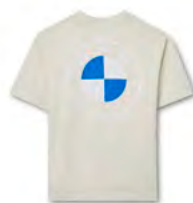
バッグ・スタイル