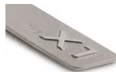
THE X1 8027 5A87 985