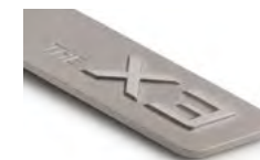
THE X3 8027 5A87 987