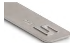
THE 5 8027 5A7E 4C1