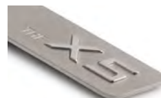
THE X5 8027 5A87 989