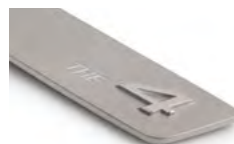
THE 4 8027 5A87 981