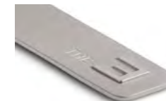
THE 3 8027 5A87 980