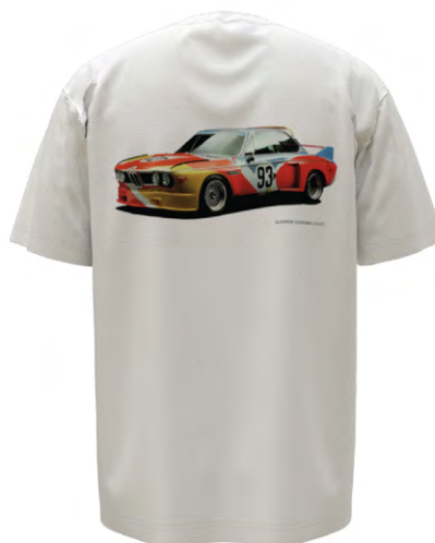
バック・スタイル