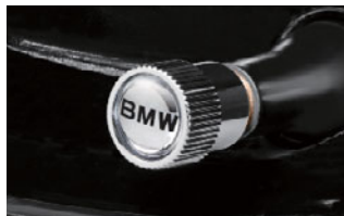
3612 2447 140 BMWワードマーク