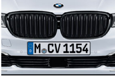
Mエアロダイナミクス・パッケージ非装備車用

M Performance ロゴ入りのサイド・スカート・フィルムです。左右のセット。