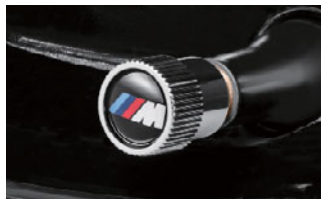
3612 2447 141 BMW Mロゴ