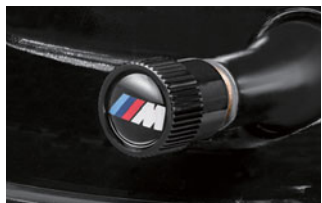
3612 2462 384 BMW Mロゴ(ブラック)

1セット4個入り。素材：ABS樹脂/エチレンプロピレン・ゴム (EPDM)、ポリウレタン製ロゴ