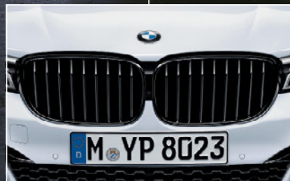
2 ブラック・キドニー・グリル