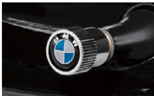
3612 2447 139 BMWロゴ