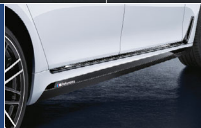
1 サイド・スカート・フィルム