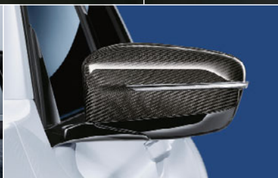
3 カーボン・ミラー・カバー