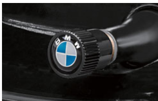
3612 2462 383 BMWロゴ(ブラック)