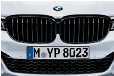
Mエアロダイナミクス・パッケージ装備車用