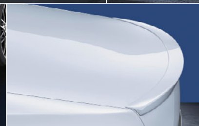
4 リヤ・スポイラー